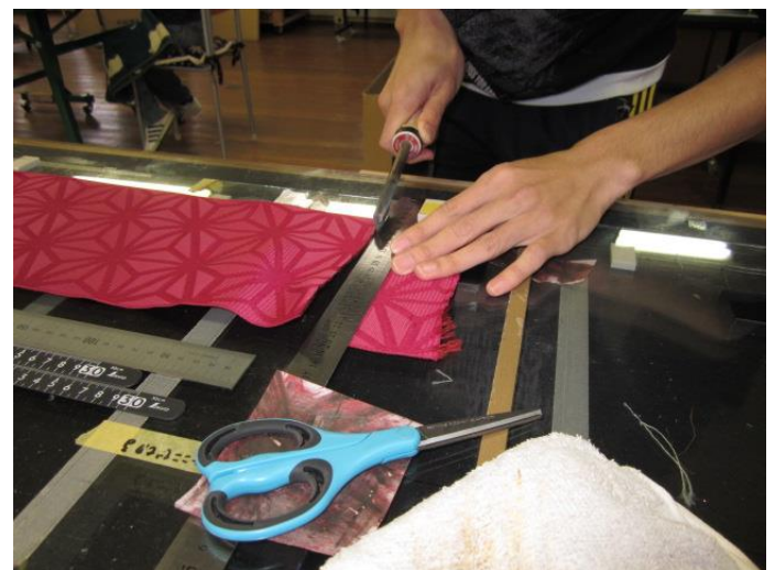
ゆかたの帯の長さを図り裁断 はさみで切るのではなく焼きコテで切ります