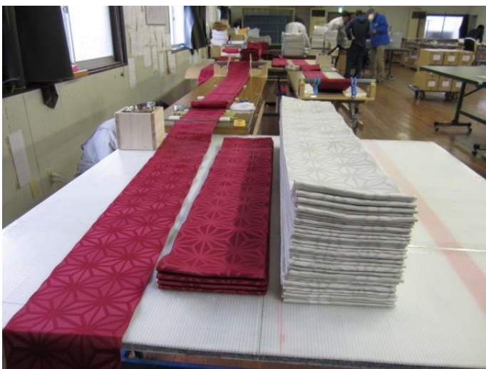
←それぞれ能力に合わせて作業を行います